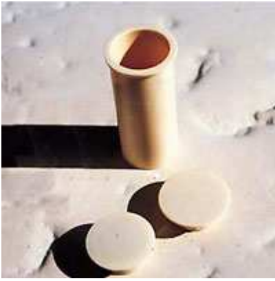
Tasseli al suo da 16 o 30mm, per sostenere i picchetti, dotati di tappi