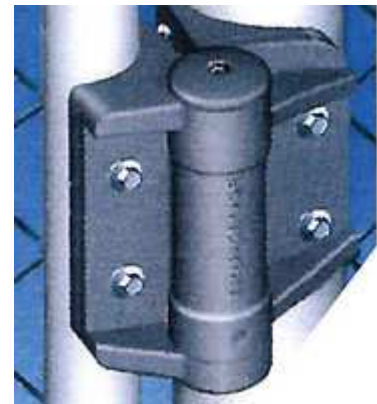
Cerniere ultra resistenti previste per un uso intenso.