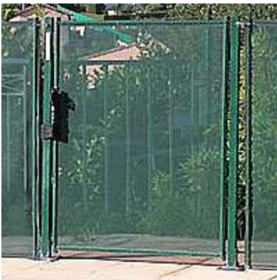
Porta con chiusura automatica per recinzione BEETHOVEN.

Questa porta è destinata a limitare l'accesso alla piscina di bambini fino a 5 anni. É adatta sia per un uso familiare che collettivo.