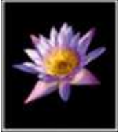
Fiore viola e giallo