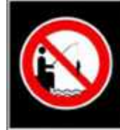
Divieto di pesca