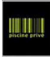
Codice a barre