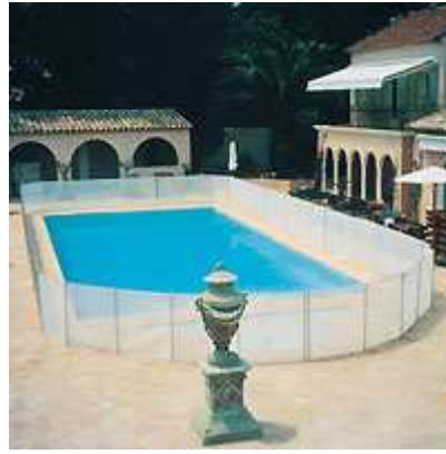
La recinzione morbida BEETHOVEN é disponibile anche in color bianco (su domanda).