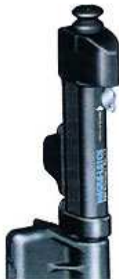
Serratura con bottone da tirare verso l'alto in caso di apertura : inaccessibile ai bambini.