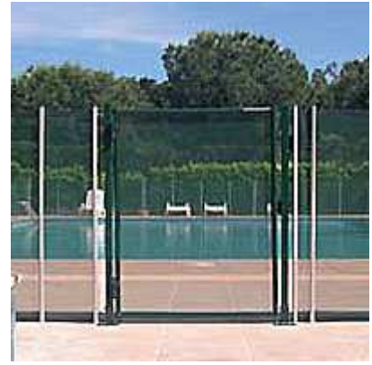
Porta a chiusura automatica, obbligatoria nel caso di piscine collettive.